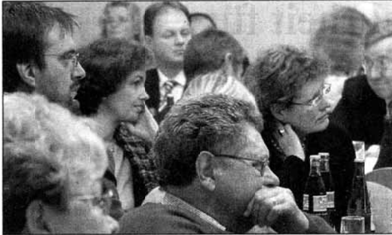
Rund 150 Gäste aus Wirtschaft, Politik und Gesellschaft nahmen am vierten Nordwalder Wirtschaftsforum teil – eine Kooperation der Werbegemeinschaft und der Gemeindeverwaltung.